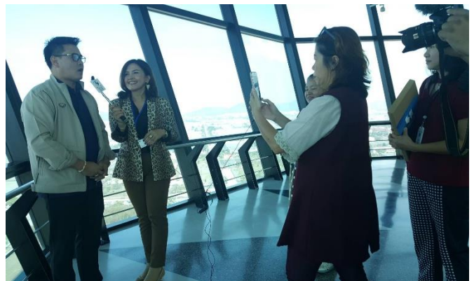
คณะสื่อมวลชน และคณะเจ้าหน้าที่จาก ศทท.๖ เยี่ยมชมและรับฟังบรรยายสรุป ศทท.๔ และเยี่ยมชมและรับฟังบรรยายสรุป ท่าเรือแหลมฉบัง เมื่อวันที่ ๕ มีนาคม ๒๕๖๒